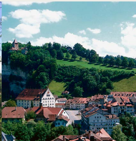
Impressionen der Velotour.

cken Bauernhöfen von Melisried, Balbertsmatt, Gäu und Heimberg queren wir ausgangs Alterswil die Schwarzseestrasse, stechen hinunter zur Zbindenmüli, erklimmen die Anhöhe von Aeschlenberg und fahren in ständigem Auf und Ab über Wolperwil, Etiwil, Röschiwil und Chueweid nach Giffers. Die Hauptstrasse verlassen wir kurz vor Tentlingen. Durch Feld und Wald und über das Dorf Pierrafortscha gelangen wir hinunter nach Bourguillon. An Stelle der Hauptstrasse wählen wir die enge Passage durchs historische Bürglentor und geniessen von der Loreto-Kapelle aus den wundervollen Ausblick auf die Freiburger Altstadt und ihre Brücken. Mit angezogenen Bremsen gehts steil hinunter in die malerische