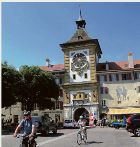
Impressionen der Velotour.

Nach dem Start bei der Bahnstation Neuenegg queren wir den Bahnübergang, biegen bei der Kirche links ab und erklimmen die Anhöhe des Brambergs. Die weiteren Stationen auf diesem welligen und aussichtsreichen Hochplateau heissen Süri, Rosshäusern, Allenlütten und Mauss. Von dort gehts in engen Kurven steil hinunter nach Gümmenen und über einen Gegenanstieg hinauf nach Rizenbach. Damit haben wir den anstrengendsten Teil der Fahrt nach Murten bereits hinter